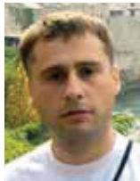
Andelko Brezovnjak, dipl. novinar

Prilično impresivan popis karakteristika za hongkonškog milijardera sir Li Ka-shinga (80), čovjeka koji s filmskim Clarkom Kentom dijeli samo slične naočale, no koji je postao simbol gospodarskog uspjeha te nekadašnje britanske kolonije, ali i cijele Kine. S procijenjenim bogatstvom od 26,5 milijardi dolara u 2008. godini, Li je prema Forbesu 11. najbogatiji čovjek na planetu.