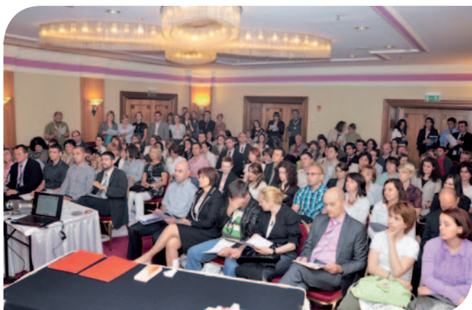
Više od 300 sudionika u tri dvorane

Prezentacije predavača potražite nakon konferencije na web stranici Poslovnog savjetnika uz pristupnu šifru.